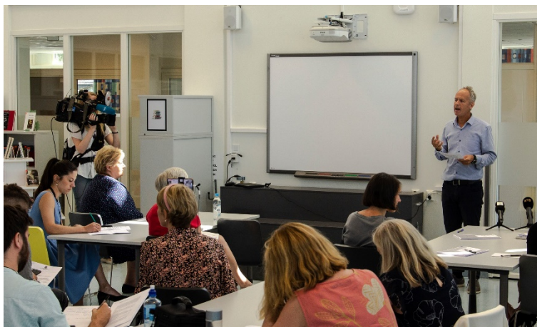
Fafo og SSB presenterte sluttrapport om den nye fraværgrensen i videregående opplæring med NRK og statsministeren tilstede.

Norsk skole er gjenstand for en rekke tiltak, både fra nasjonalt og lokalt nivå, som er ment å forbedre elevenes læring, læringsmiljø og psykososiale miljø. Gjennom flere prosjekter evaluerer vi denne typen tiltak, med sikte på å kunne vurdere hvordan implementeringen er gjennomført og hvorvidt de har positive effekter. Frafall fra videregående opp-