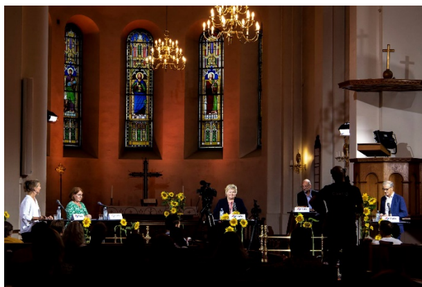
Fredag 21. august inviterte Fafo til en samtale i Grønland kirke mellom forskere, statsminister og Høyre-leder Erna Solberg og Arbeiderparti-leder Jonas Gahr Støre. Temaet var «Norge ut av koronakrisa».