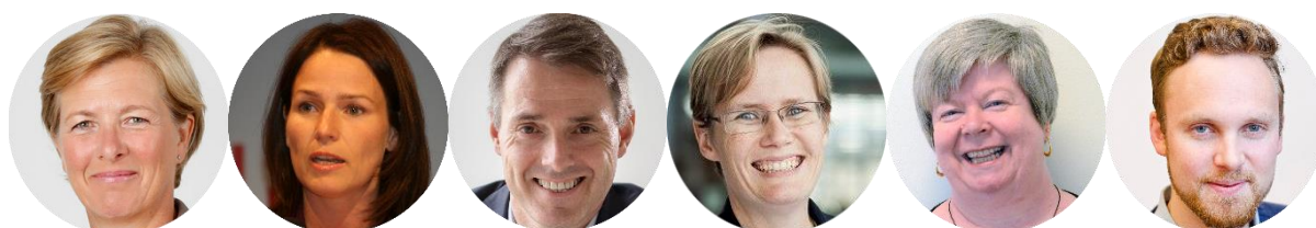
Foto: F.v: Østerud, Sundnes, Kristensen, Solli, Hilsen og Steen. Mangler foto av Pedersen og Andersen, Meny.

https://www.arendalsuka.no/event/view/11522