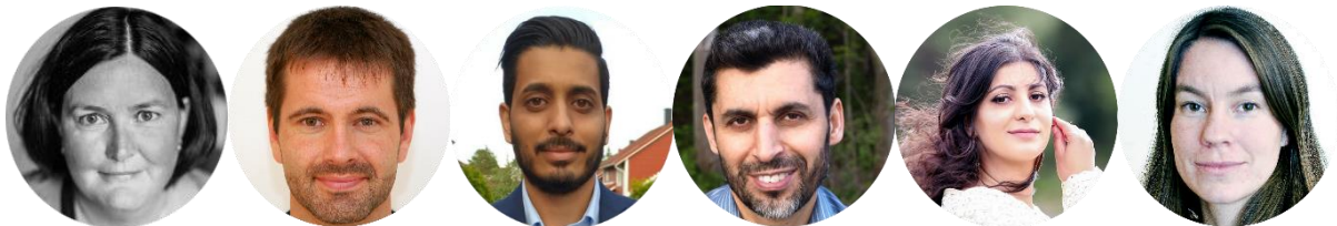
Foto: F.v: Joys, Elgvin, Qureshi, Basim Ghozlan, al-Nahi og Lillevik

https://www.arendalsuka.no/event/view/11648