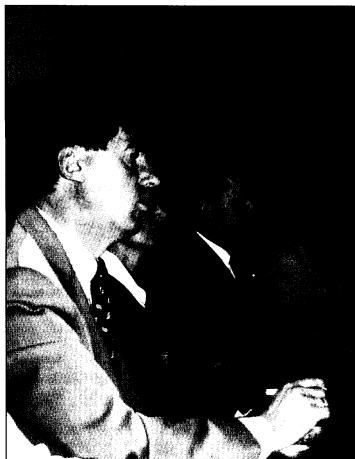
DEBATT: Norsk baltikum-politikk var tema under et seminar hvor både politikere og fagfolk deltok.