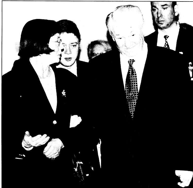
IKKE HELT STØ: President Boris Jeltsin i Stockholm understreker at de baltiske landene skal tilhøre Russlands innflytelsessfære. Det mener ikke de baltiske landene selv.

■ ■ I de baltiske landene er en viss resignasjon allerede i ferd med å bre seg. - Vi blir nok svikket denne gangen også, er allerede etablert som et munnhell i Latvia og Litauen når folk snakker om presset fra øst, og det sterke ønsket om å tilhøre Vesten. Og den resignerte to-