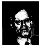
NATO-JA: Utenriksminister Vollebæk er positiv til baltisk Nato-medlemskap