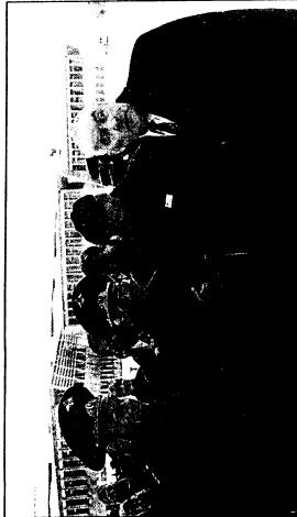
» I DET GODE SELSKAP. Medlemskap i NATO handler ikke bare om sikkerhet mot russisk press og dominans, men også en aksept fra Vesten om at Baltikum er inkludert i det gode selskap, skriver dagens kronikkforfatter. Her fra går dagens nordiske forsvarsminister på Roma. Norges forsvarsminister Dag Jostein Flørvold vises i frem forsvarets nyhetsbrev for den russiske forsvarsministeren, Igor Sergejev.

Det tredje poenget er at det å demonstrere solidaritet og vilje til å inngå samarbeid med de baltiske land er viktig for Norge. Det er viktig å være aktive i de andre sikkerhetspolitiske arenaene som er i ferd med å utvikles. Det er viktig å være aktive i de andre sikkerhetspolitiske arenaene som er i ferd med å utvikles.