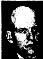
Statsminister Guntars Krasts

Norge støtter balternes holdning. Utenriksminister Knut Vollebæk, som holdt et foredrag på seminaret, under-