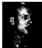
HÅP: Den latviske statsministeren ønsker at Baltikum oppfattes som en del av Europa.