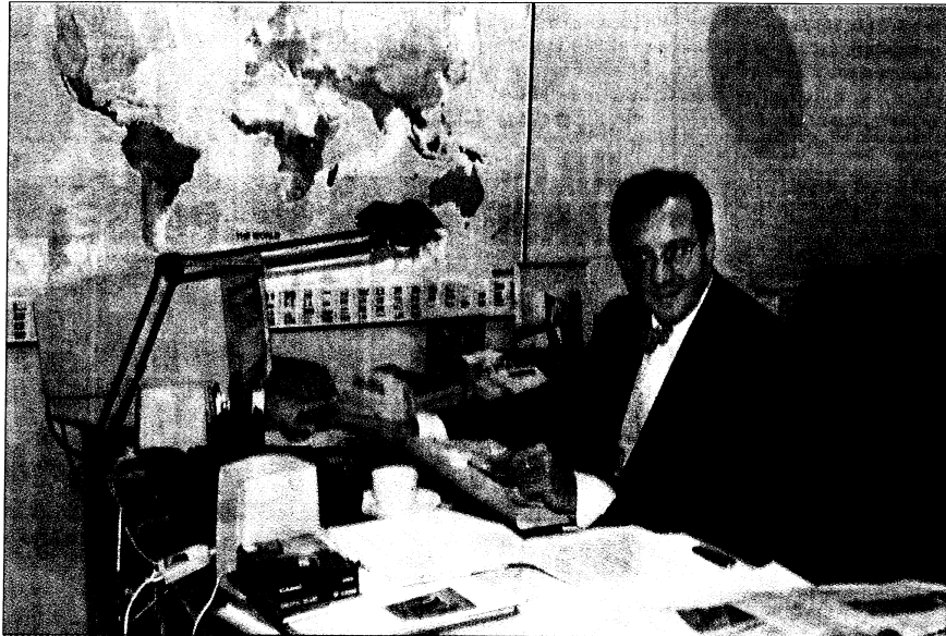
Estlands utenriksminister Thomas Ilves vender de andre EU landene ryggen og vil ikke forsøke å overbevise EU om alle de tre baltiske landene bør starte medlemskapsforhandlinger samtidig.

Selv om han ønsker at de andre baltiske landene også blir invitert til forhandlingsbordet etter hvert, setter han pris på at kommisjonen har vurdert de tre landene på individuelt grunnlag.