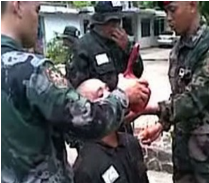
Indvielsesritual i det Filippiniske politi